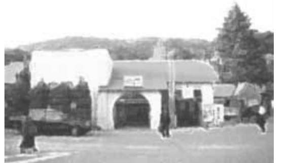
【JR山崎駅】昭和2年に建てられた土地を約30m削って平坦にし、現在の駅舎が建てられました。地下通路は木組みの骨組みが当時のまま残っています。国鉄からJRに変わった折に茶色の屋根から青色に変わりました。